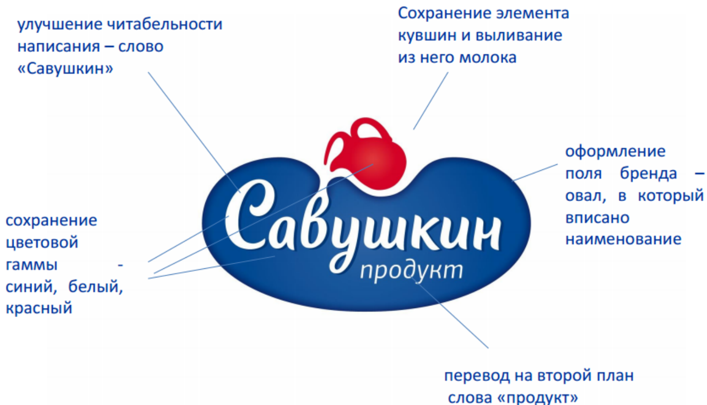
Рисунок 2.4 - Результат работы

В 2015 г. название «Савушкин продукт» стало короче – просто «Савушкин». Оно объединяет сегодняшний день и лучшие традиции прошлого: Савушка – старославянское имя, символизирующее человека-хозяина, труженика, доброго хранителя традиций производства молочных продуктов.