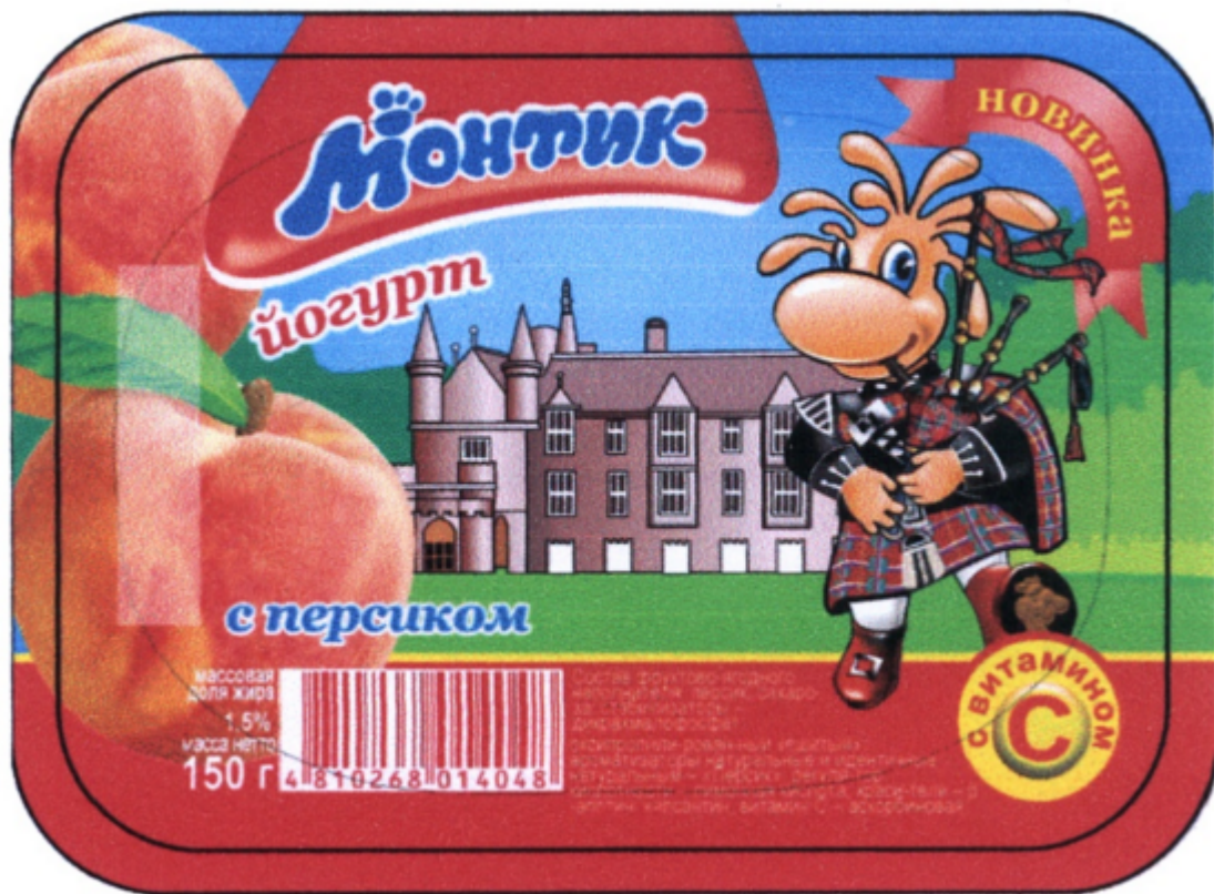
Рисунок 3.1 - Логотип йогурта «Монтик»